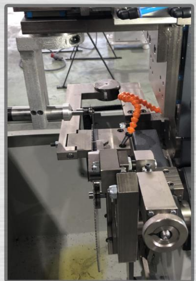
Автоматическая заточка левого и правого паза