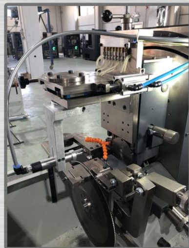
Прочный блок заточки