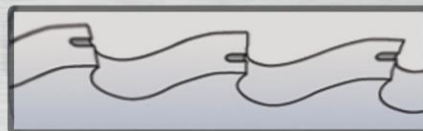
Br - Bs Формы