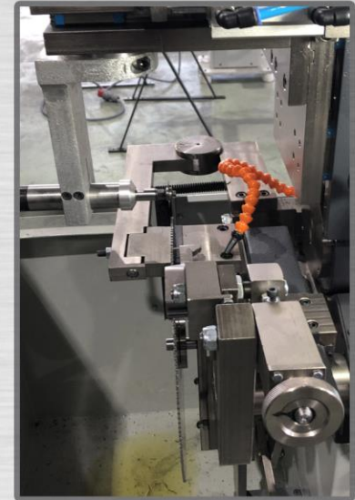
Otomatik Sağ-Sol Slot Bileme