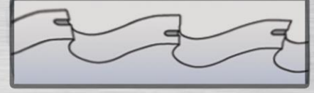
Br - Bs Formları