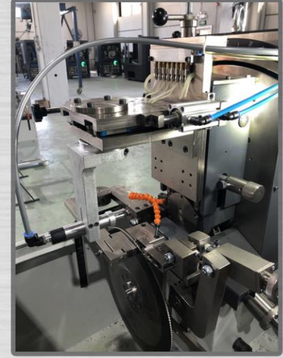
Sağlam Bileme Ünitesi