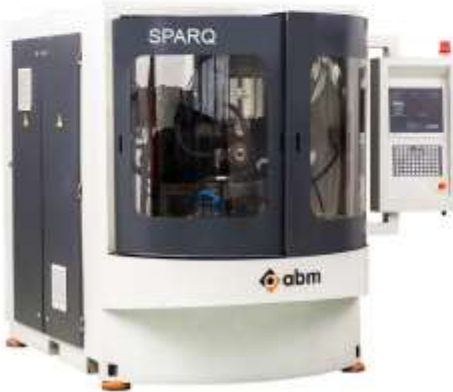
Üniversal takımlar için