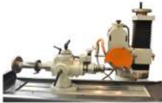
Opsiyonel Helis Aparatı