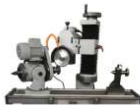
Opsiyonel Dairesel Bıçak Aparatı