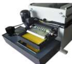
Opsiyonel Manyetik Seperatör