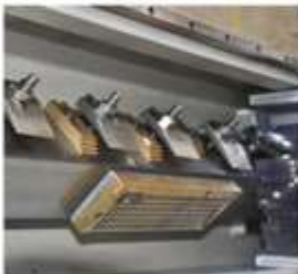
Standart T-Slotlu Mekanik Tabla