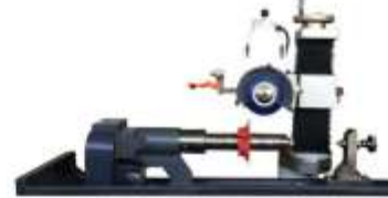
Opsiyonel Motorize Divizör Aparatı