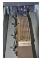
Takma Uçlar için Opsiyonel Manyetik Aparat