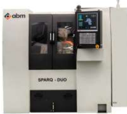
Yan Bileme için