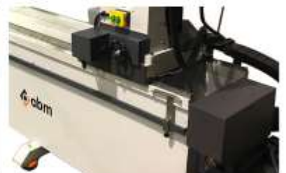
Opsiyonel Motor Kontrollü Talaş Verme (0,005mm)