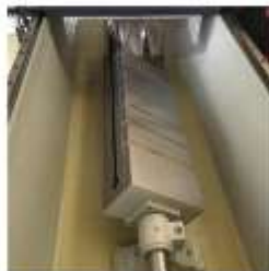
Opsiyonel Manyetik Tabla (Yan tarafta T-Slot sistemi ile)