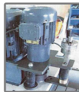
Блок финальной заточки