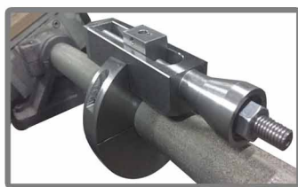
Средство для правки заточного круга