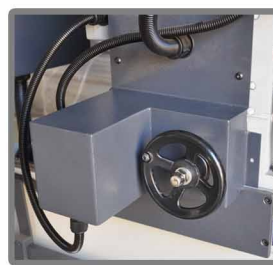
Для карбидных ножей контроль двигателем подачи съёма