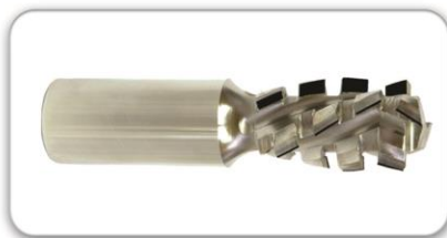
Спиральные и прямые фрезы