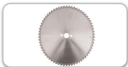
Дисковые пилы и дробилки

3 основных типа инструмента, затачиваемых станком SPARQ: