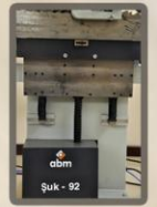
Motor para o movimento vertical da serra