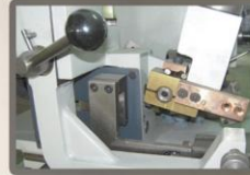
Estelite manual e revenido automático

Estelidade de precisão e revenido na mesma máquina garantindo uma perfeita qualidade de corte e muito mais durável.