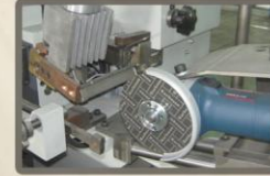
Corte gota estelite mediante ângulo de afiação