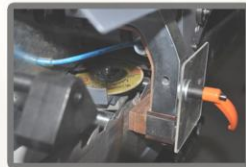
Corte gota estelite mediante ângulo de afiação

Estelidade de precisão e revenido na mesma máquina garantindo uma perfeita qualidade de corte