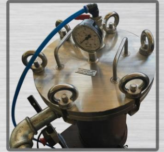
Pressure Indicator Basınç Göstergesi Индикатор давления