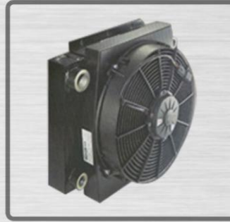
Optional Cooling System Opsiyonel Soğutma Sistemi Опциональная система охлаждения